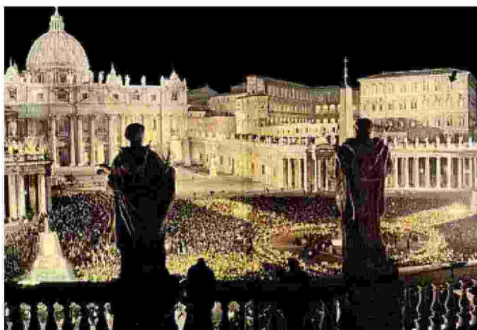
Una suggestiva veduta notturna di Piazza San Pietro